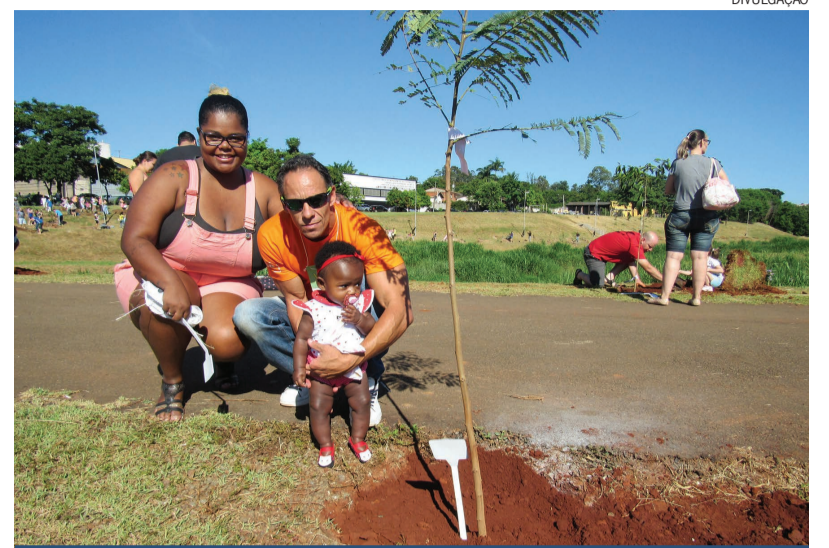
O 15º Plantio de árvores simbolizou o nascimento de bebês na Unimed Limeira durante o ano de 2017

projeto que conta com a parceria da Prefeitura Municipal de Limeira, e da Secretaria de De-