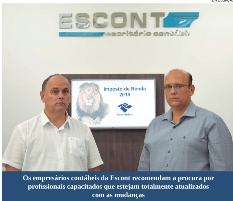
Os empresários contábeis da Escont recomendam a procura por profissionais capacitados que estejam totalmente atualizados com as mudanças

Desde o dia 1º de março a Receita Federal iniciou o recolhimento das declara-