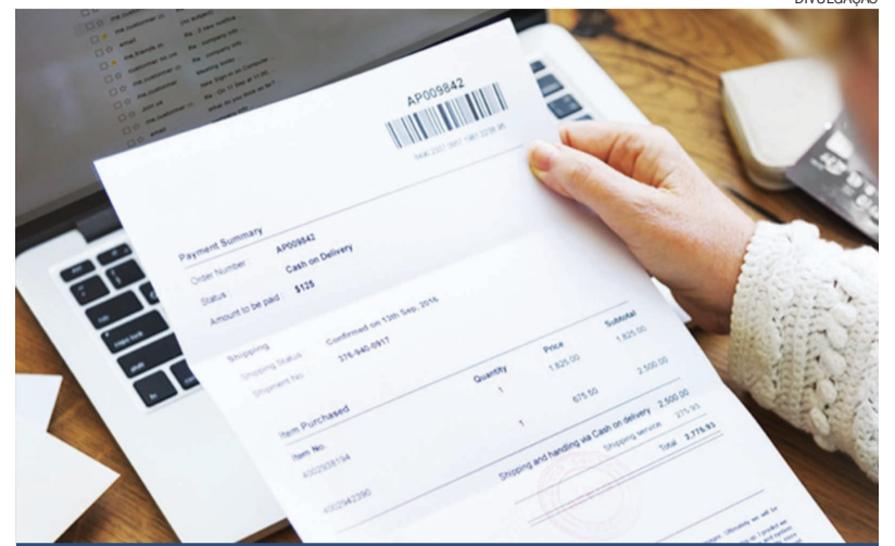
Em 22 de setembro o processo será concluído com a inclusão dos boletos de cartão de crédito e de doações, entre outros.

O calendário inicial previa que a nova plataforma incluíse todos os boletos a partir do fim de 2017. “Mas foi necessária uma adaptação para garantir a segurança e a tranquilidade no processamento, em